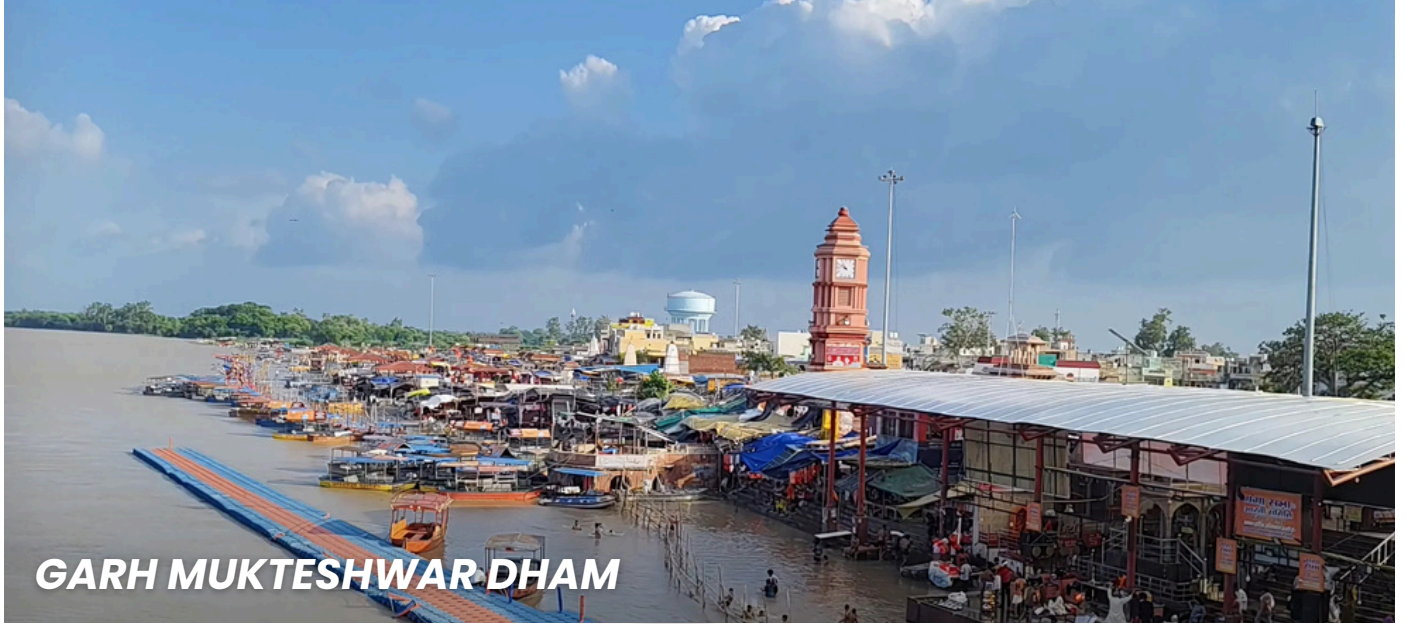
GARH MUKTESHWAR DHAM